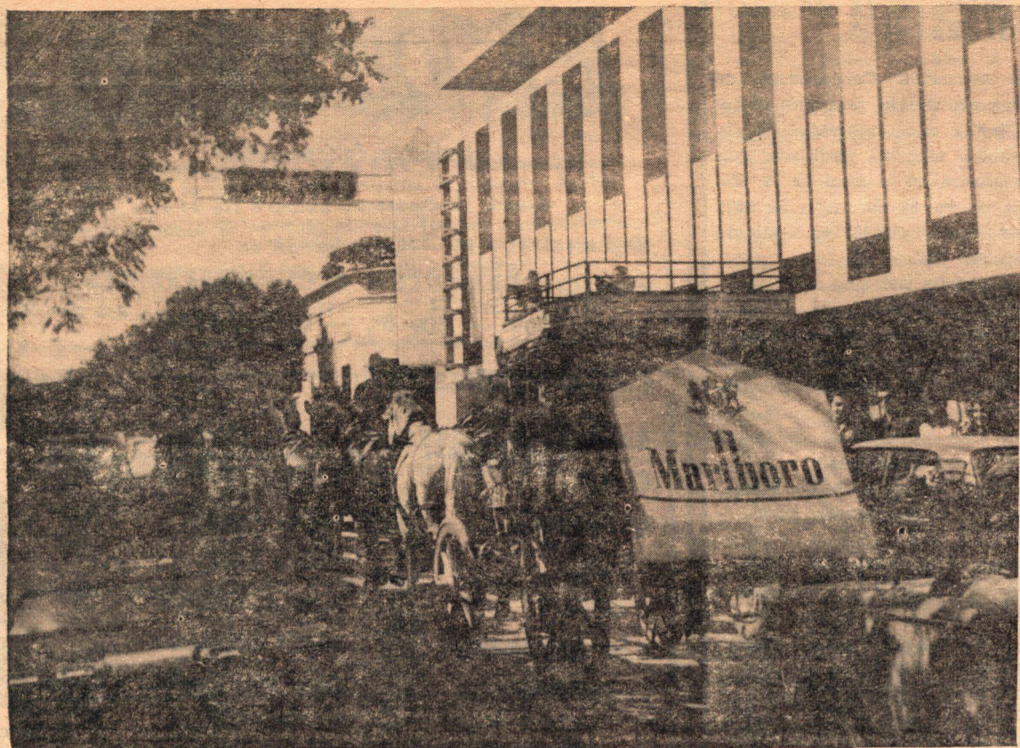
LA DILIGENCIA MARLBORO TRANSITA CALLES DE LA CAPITAL DESDE DONDE VENDRA Los representantes exclusivos de