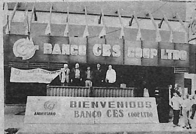
Integrantes del Consejo de Administración del Banco Ces, organizadores del evento.

Una verdadera fiesta atlética que premia el esfuerzo del Banco CES Coop. Ltda. al conmemorar un nuevo aniversario de su prestigiosa vida institucional