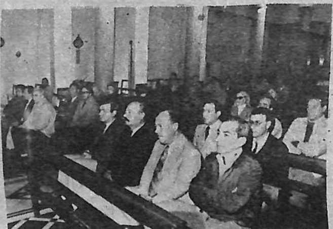
Autoridades asistentes a la ceremonia religiosa.