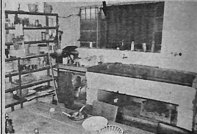
La flecha indica el lugar por donde ingresaron los responsables de los destrozos.

Acto vandálico se produjo en las instalaciones del Club Olimpia, en la noche del martes pasado.