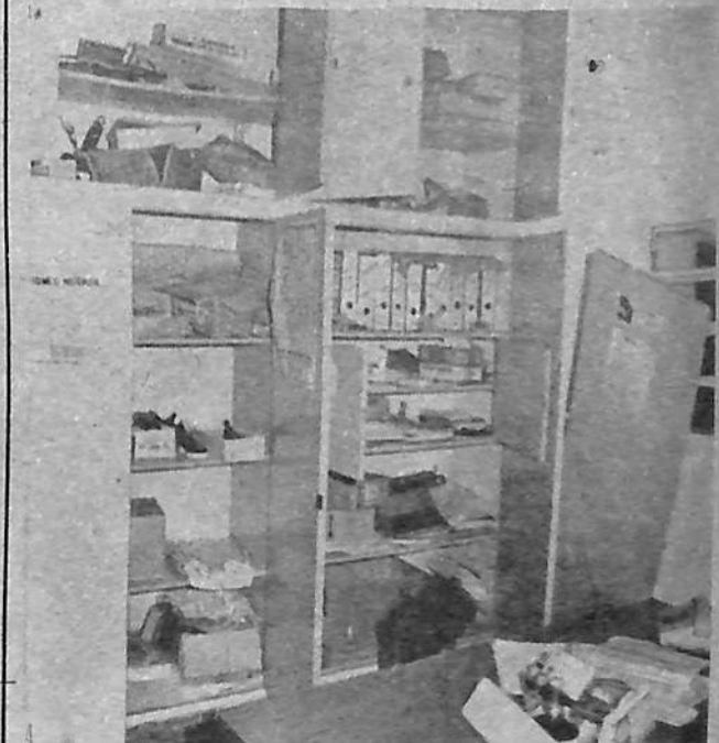
Otro aspecto luego de que pasaran los inadaptables.

Se cree que los inadaptables ingresaron luego de la rotura de un vidrio y la posterior apertura de una reja, lo que indicaría que la contextura física no sería importante.