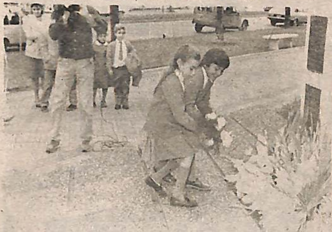
Alumnos del Taller de Periodismo de la Escuela Dante Alighieri, también se hicieron presentes en el homenaje a los periodistas.

El pasado 7 de junio se celebró el Día del Periodista, evocando la figura de Mariano Moreno a 179 años de la creación de la Gaceta de Buenos Aires.