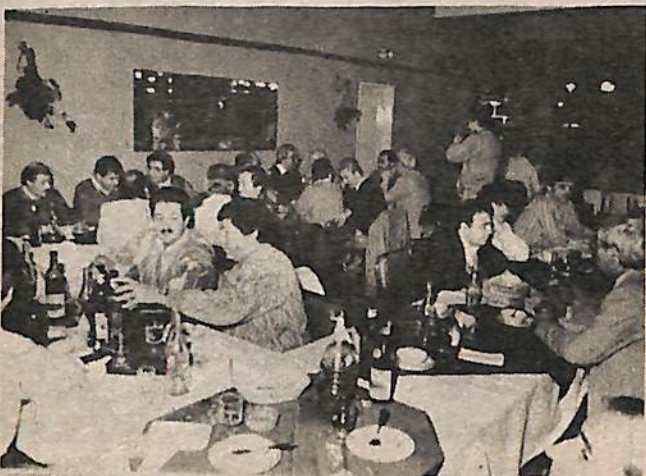
Por la noche se realizó una cena

Vaya nuestro homenaje a todos nuestros colegas que en estos momentos difíciles, agudizan los esfuerzos para poder brindar su trabajo en beneficio de la comunidad, dentro de este contexto se afianzaron los propósitos de seguir trabajando en comunión de ideas, rescatando la cordialidad que reina entre los periodistas de nuestra ciudad.