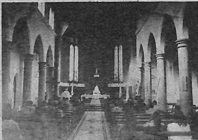
Aspecto que ofrecía la Iglesia Catedral.