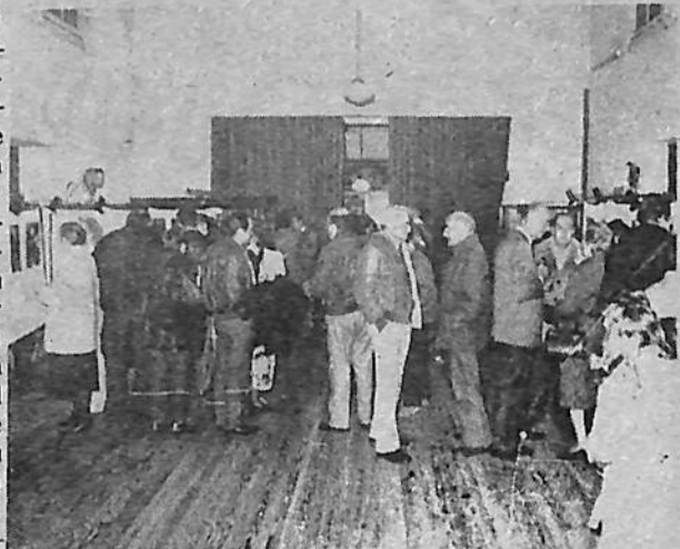
Presentes en la Sala J.A. Valdez durante la inauguración.