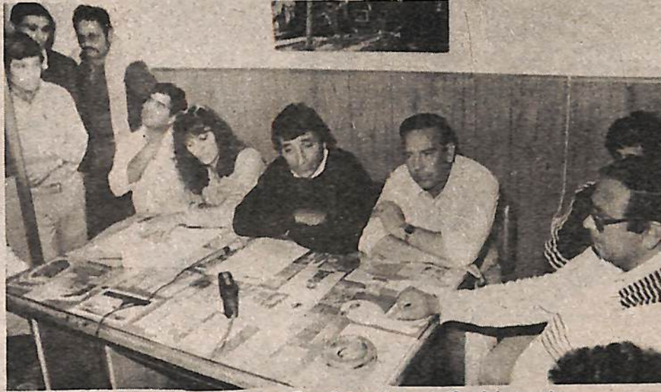
Boladeras, Villalba y Bernárdez, la posición del gremio.

sueldos, que está a disposición de quien lo desea, y la categoría 15 que es la máxima de los auxiliares y con el aumento llegaría a un básico de A 8.500, es cierto que hay personal que cobra A 14.000 y es la categoría 20, un jefe de departamento, personal jerarquizado.