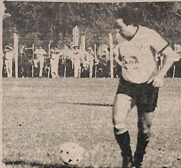
Vilarino, 2 goles para el triunfo de Central.