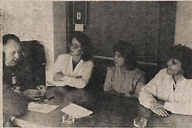
Integrantes del Centro de Bioquímicos.

no estamos convencidos, pero es probable que se haya especulado con volúmenes muy importantes de dinero que pongan a plazo fijo, y a nosotros era fácil pagarnos los punitivos, en este mes el Centro le pide a las Obras Sociales que liquiden sus facturas 15 días corridos después de presentadas y los intereses por mora serán los que fija el Banco de la Nación para el descuento de documento, para normalizar el tema".