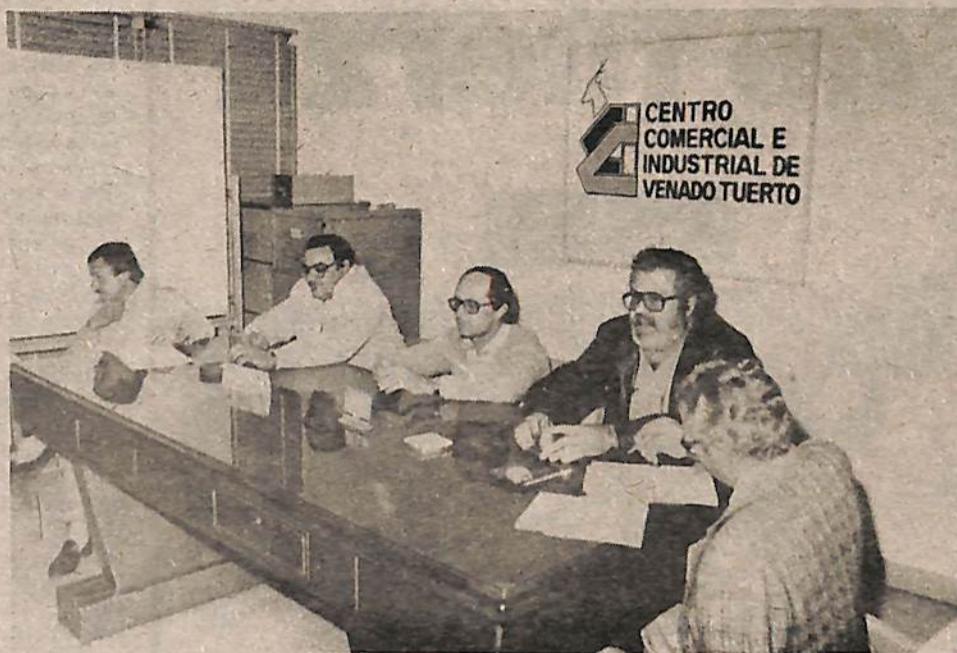
Reunión de industriales. Se analizó la actual crisis.

La Comisión Directiva junto a sus asociados han determinado estar en sesión permanente, habida cuenta de la situación imperante.