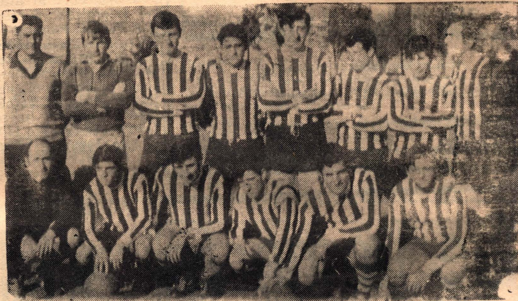
EL EQUIPO DE TEODELINA F. C. - Unico invictó en la Zona C