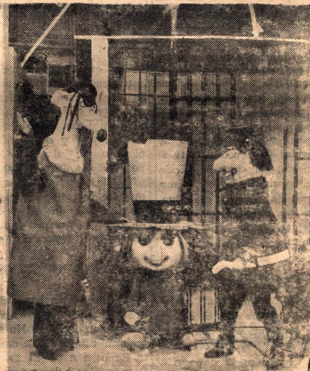
Hijitos, Larguillucho y el Comisario sorprendidos durante una de las graciosas aventuras que semanalmente protagonizan en "El Club de Hijitos", programa infantil que produce Proartel y que cuenta con la total adhesión de "la gente menuda".