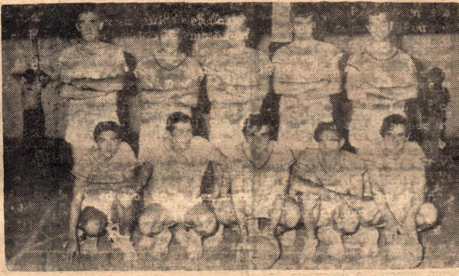
El equipo de Unión Deportiva que estará presente en este torneo

A todo ritmo la gente de Atenas están dando los últimos toques en la organización del torneo 30 Aniversario «Alberto Raies»