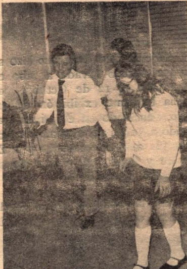
Demostración de danzas por mogólicos.