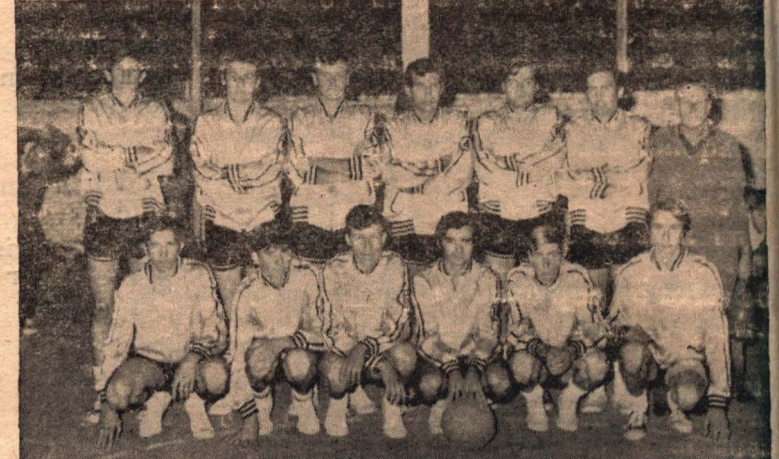
Peñarol, recibe esta noche la visita de U. Deportiva

Esta noche en nuestra ciudad se enfrentarán los equipos de Olimpia y Centenario y en Elortondo, Peñarol recibirá la visita de Unión Deportiva, el reciente vencedor de Centenario