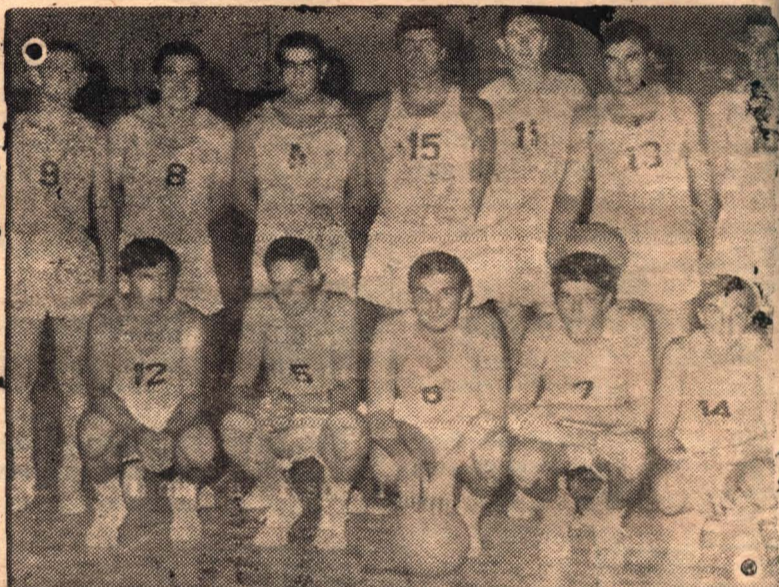
El equipo de Centenario, que irá por la reahilitación en su partido con Olimpia