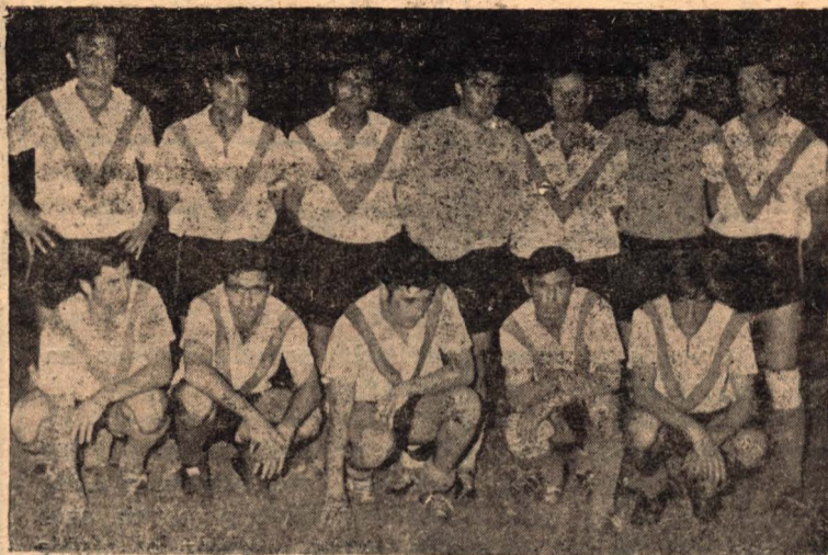
El equipo de Rivadavia

Un partido intenso y con un resultado que consideramos justo y que dejó conforme a la numerosa concurrencia fue el que libraron estos dos conjuntos.