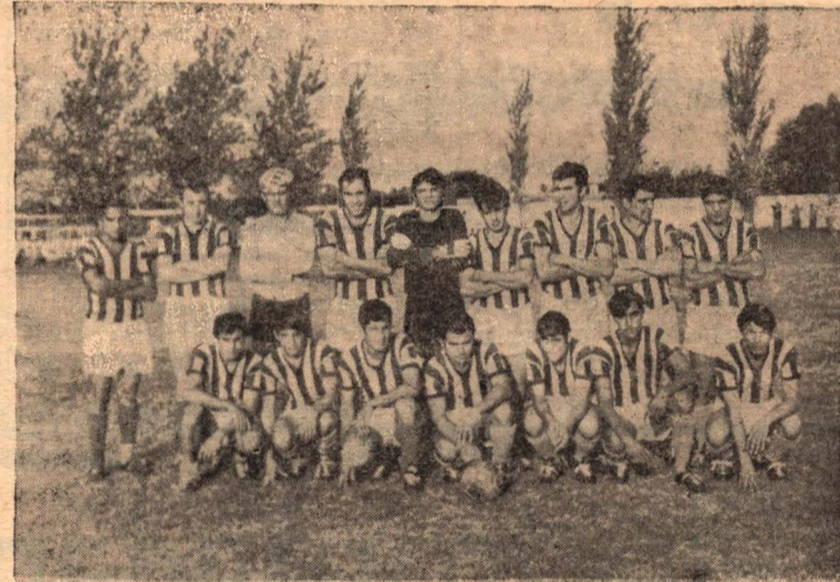
El equipo de Centenario