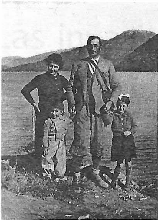
Familia de inmigrantes. en la Patagonia, 1941

bió algunos libros breves, sobre todo procuró unir a la "familia anarquista" y salvarla de sus tendencias centrífugas. Con el tiempo editaría también los periódicos L'Associazione , L'Agitazione , Volontà , Umanità Nova y Pensiero e Volontà . Pasó treinta y cinco años de su vida en el exilio, difundiendo "la idea" por España, Francia, Suiza, Inglaterra, Portugal, Egipto, Rumania, Austria-Hungría, Bélgica, Holanda, Estados Unidos, Cuba y Argentina. En 1874 fue encerrado en la cárcel por primera vez por liderar una insurrección en Apulia. Tres años después, al mando de una banda de anarquistas, Malatesta ocupa la aldea de Letino, donde, en presencia de los campesinos, destituye al Rey Vittorio Emanuele y ordena quemar los registros fiscales de la región. La bandada anarquista se dirigió luego al pueblo de Gallo, donde rompieron la medida con la que se ponderaba el impuesto en harina. Nuevamente es llevado a juicio y condenado a tres años de prisión, de los que cumple solamente uno. Más adelante pasaría muchas temporadas en la mazmorra. Cuando ya se había hecho un nombre en los ambientes anarquistas, logra sortear una orden de detención impartida en Florencia introduciéndose en un barco, oculto en una caja que