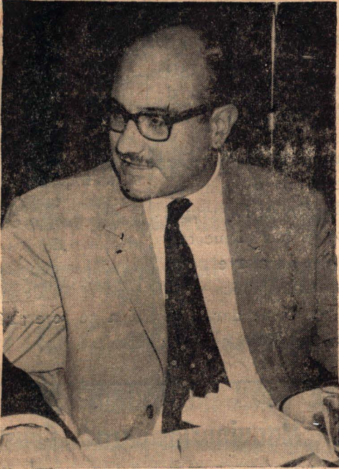
Tito Livio Coppa, Ministro de Agricultura de la Provincia, presente en esta ceremonia

La Compañía Continental que adquiriera el semillero Santa Teresita situado sobre la ruta 33 ha realizado grandes reformas en el mismo a fin de que sea una planta modelo de clasificación y tratamiento de semillas de híbridos habiéndose realizado en el día de ayer la inauguración del moderno establecimiento.