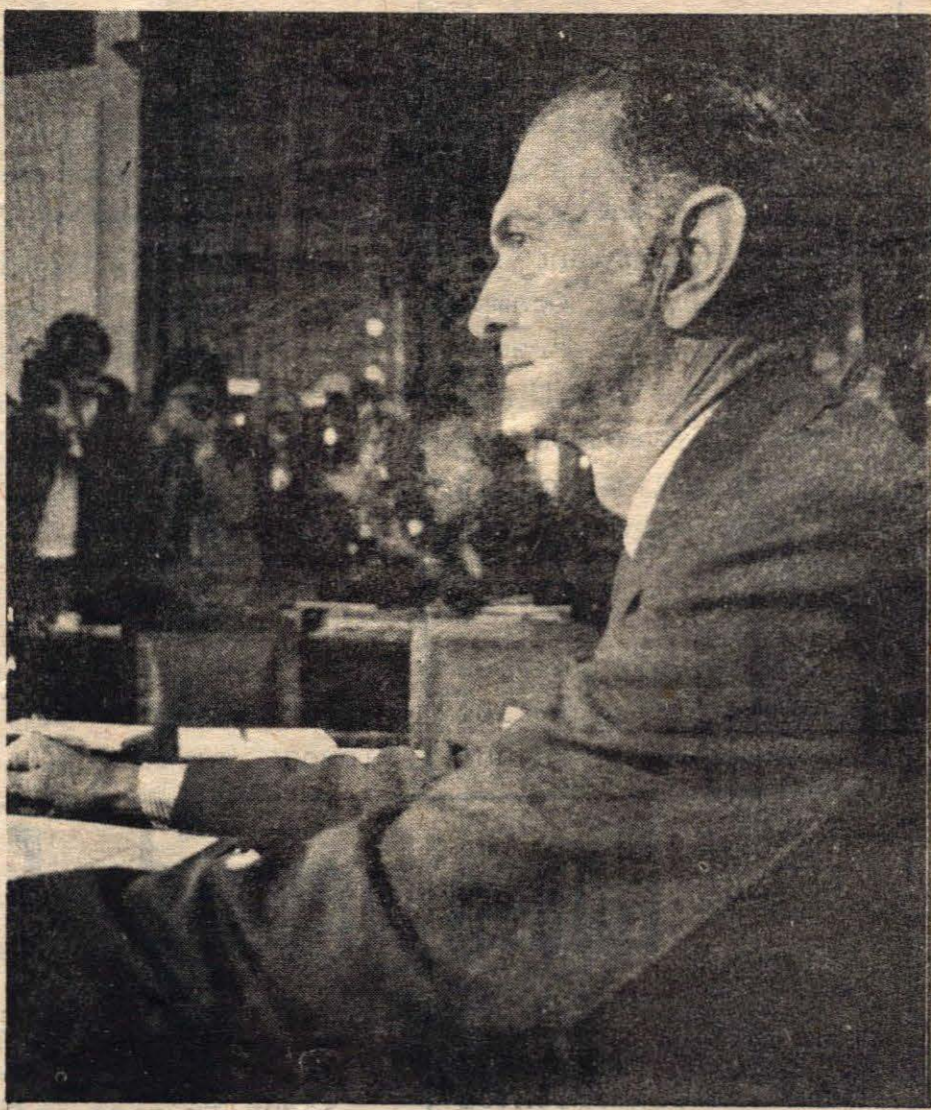
JOSEALFREDO MARTINEZ DE HOZ (a) "Joe", ayer prestó declaración ante la Comisión del Congreso que lo investiga.

El ex Ministro, que ya declaró la semana pasada, durante trece horas, está haciendo antesala en el despacho de la Comisión de Presupuesto y Hacienda de la Cámara de Diputados, en el tercer piso del Congreso.