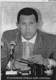
El presidente Chávez salió victorioso.

CARACAS (EFE). Los candidatos del Polo Patriótico, el grupo de partidos que apoyan al presidente, Hugo Chávez, obtuvieron 20 de los 24 escaños correspondientes a la circunscripción nacional, con el 76,5 por ciento de los votos escrutados, en las elecciones constituyentes que se desarrollaron ayer. Los otros 104 escaños serán cubiertos con los asambleístas que sean elegidos en los estados, mientras que los tres que faltan para completar los 131 escaños que tendrá la Asamblea Nacional Constituyente (ANC) corresponden