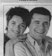
Fort Boyard. A las 23 por Canal 13.