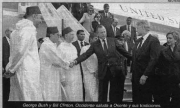
George Bush y Bill Clinton. Occidente saluda a Oriente y sus tradiciones.

RABAT (EFE). Más de un millón de personas se congregaron en Rabat para dar el último adiós al rey Hassan II de Marruecos, fallecido el pasado viernes y cuyos funerales se celebraron ayer con la presencia de altos dignatarios de 53 países. Las honras fúnebres se iniciaron con el levantamiento del cadáver en el palacio real por el primogénito del rey desaparecido y sucesor en el trono, Mohamed Ben Al Hassan, su hermano, el príncipe Muley Raschid, y otras personalidades. Entre los dignatarios extranjeros se encontraban los presidentes de EEUU Bill Clinton -que habló con la mayoría de los mandatarios involucrados en el proceso de paz en Medio Oriente-; de Francia, Jacques Chirac; de Italia, Carlo Azeglio Ciampi; de Egipto, Hosni Mubarak,