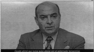
Cavallo afirmó que nunca quiso aliarse con el gobernador bonaerense

«Si Duhalde busca ganar la elección por el Plan Cavallo» en una de esas voy al apoyo. A lo mejor, si adopta el Plan Cavallo comienza a acortar distancias con De la Rúa, señaló el aspirante a la presidencia al hacer mención a las últimas encuestas que hablan de una ventaja de más de 10 puntos en favor del candidato de la Alianza. En declaraciones a radio Del Plata, agregó que «a nosotros nos interesa trabajar con quien sea, con Duhalde, De la Rúa, o con cualquier dirigente que tenga buenas intenciones, que tenga un plan y que sepa qué se a hacer el día que acceda al poder». Por otro lado, Cavallo ratió sendos en los que se señala que obtiene un 10 por ciento de votos en Capital Federal y Gran Buenos Aires, al afirmar «las encuestas coinciden con las que hacemos nosotros todas las semanas».