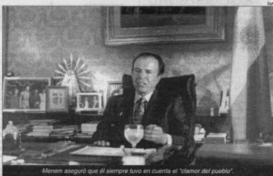
Menem aseguró que él siempre tuvo en cuenta el «clamor del pueblo».

Menem también se refirió al panorama preelectoral y afirmó que « lo que digan las encuestas hay que tomarlo con pinzas », al referirse a los sondeos que a menos de tres meses de las elecciones indican un triunfo del candidato de la Alianza, Fernando de la Rúa, sobre el