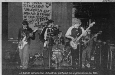
La banda vernácula «Luistrín» participó en la gran fiesta del MIA.

reflejaban las bondades de los desenfrenos humanos en cuanto al alcohol y al sexo. «Tiene mucho que ver con lo que nosotros contamos en nuestros canciones» expresó el músico. En cuanto a su trayectoria, hace diez años que existe Carmina. En un principio eran un cuarteto y ahora conforman un septeto. Lo vistoso de su música está dado en que cuentan con un saxo y una trompeta. Cuentan con el orgullo de haber sido teloneros de Bersuit Vergarabat - haber tocado con los instrumentos de estos - y de Todos Tus Muertos. Además tocaron en Cemento, bolche porteno cuna del