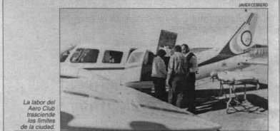
La labor del Aero Club trascendiendo los límites de la ciudad.

Trasladaron a una anciana indigente, ciega, desde Paso de los Libres a Venado Tuerto.