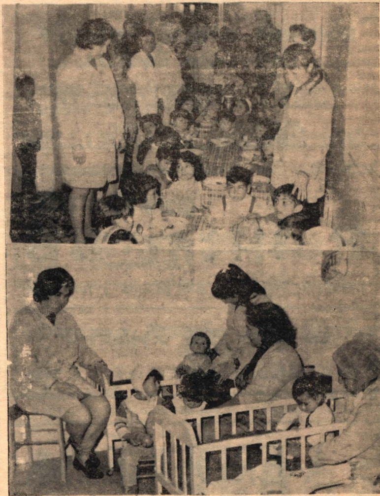
La nota gráfica superior nos muestra el momento en que los chicos están almorzando y controlados por el personal, para luego llevarlos a la Escuela...

Con motivo de celebrarse el DIA DEL SUMO PONTIFICE, la MISA VESPERTINA DE LA IGLESIA CATEDRAL se ofrecerá por Su Santidad Paulo VI