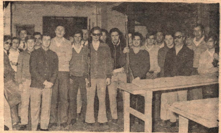
Aquí el grupo de los tiradores que participaron en el torneo Intercolegial y que alcanzó lucidos resultados.