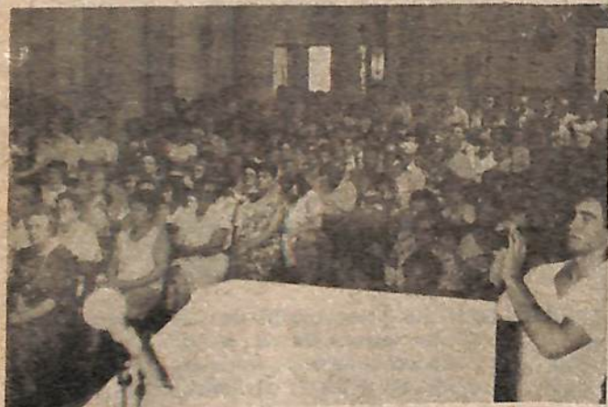
Aspecto que presentaba la Iglesia Catedral ayer.