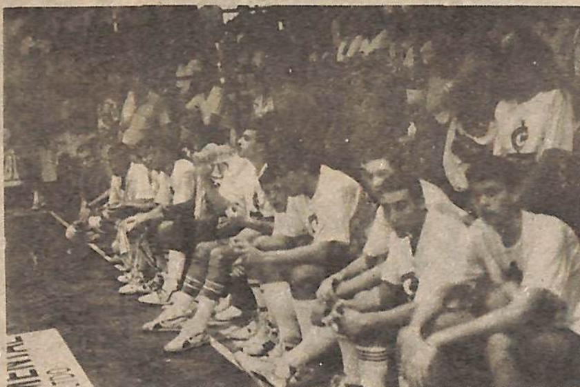
El nuevo Olimpia antes de la presentación