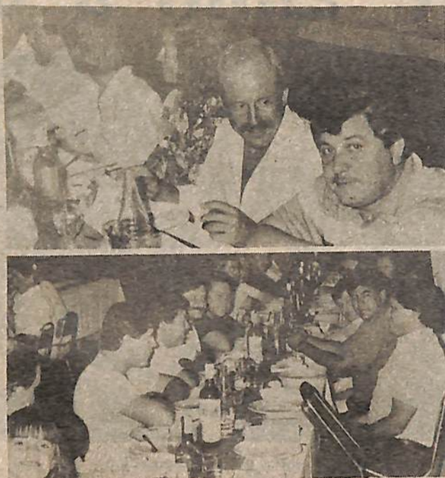
Durante la cena de camaradería, el agasajo a los visitantes.