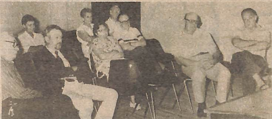
Asistentes a la charla en Biblioteca Alberdi.

es neutra, se puede usar o no, es la persona quien debe controlar esto."