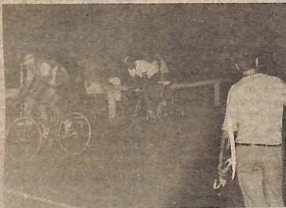
La largada de Veteranos.