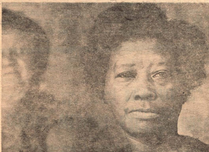
Tercer Premio — Alfredo | Matanza 3 Hernandez — Foto Club