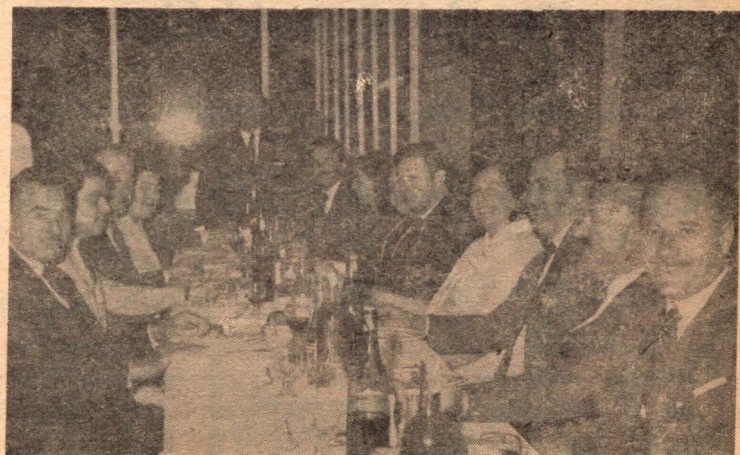
Un aspecto de la celebración del Día del Martillero.