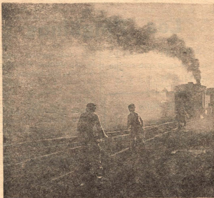
Quinto Premio — Augusto | Club Vdo. Tuerto. Imperiale — Foto Cine