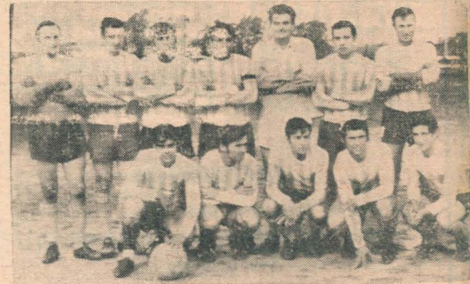
UNION Y CULTURA que enfrentará a Juventud Unida, por el Torneo Joyería Cuesta