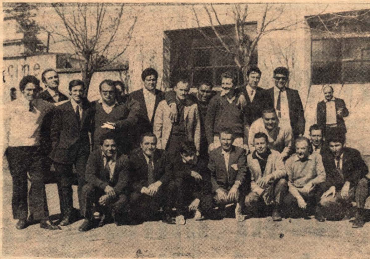
Conjunto de deportistas que integraban la delegación de Rufino que asistió al torneo del Club Olimpia.

Continúa siendo igual en calidad Continúa siendo el mejor lugar Nos referimos a su