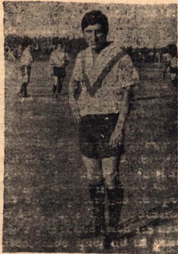
Mendoza, importante pieza en la planificación de juego en Rivadavia.

En la zona A las posiciones pueden quedar definidas ya que solo tres equipos tienen las posibilidades de clasificarse para la ronda final y dos de ellos juegan entre si, rivadavia (18 puntos) visitara a Jorge Newbery que ha reunido 15 unidades, con solo empatar