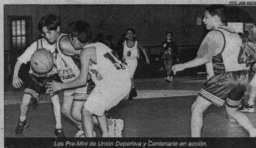
Los Pre-Mini de Unión Deportiva y Centenario en acción.

El domingo pasado se realizó un nuevo encuentro de básquetbol en el gimnasio "Giocando Semprini" del Club Unión Deportiva Chanta Cuatro Sarmiento de la ciudad de Venado Tuerto. Los partidos amistosos fueron para las categorías Mini, Pre-Mini, Pre-Infantiles y Mosquitos, con la participación del club anfitrión, Unión Deportiva, y la visita del Deportivo Atenas y Centenario. Todo comenzó a las 10.30 de la mañana con el encuentro de Pre-Infantiles entre Atenas y Centenario. Luego se enfrentaron los Mosquitos de Unión Deportiva y Centenario; mientras que después de un breve