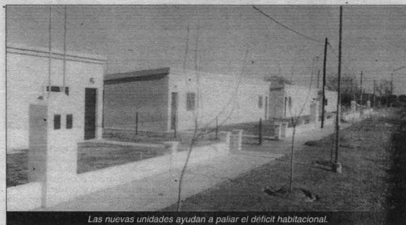
Las nuevas unidades ayudan a paliar el déficit habitacional.

Camino destacó que algunas terminaciones «se hicieron con fondos de la Comuna, como por ejemplo el reboque fino, las carpetas de los baños y el aporte y colocación de la puerta de cada dormitorio, que luego cada adjudicatario deberá devolver en cómodas cuotas de