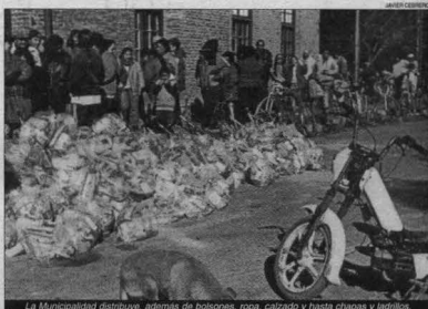
La Municipalidad distribuye, además de bolsos, ropa, calzado y hasta chapas y ladrillos.

Scott dijo que la Municipalidad no puede solucionar toda la problemática social y acude a paliar los hechos más acuciosos que se presentan. Entregamos ladrillos, chapas, tirantes o les damos los planos a aquellas familias que desean construir su propia casa, brindándoles la posibilidad de que puedan ampliarla en el futuro, cumpliendo con los requisitos mínimos que exige el planeamiento urbano de la ciudad, destacó, para luego indicar que también el Municipio asiste a la población de es-