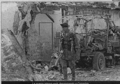
La guerra interna está desangrando a Colombia.

BOGOTÁ (Telam-SNI). El responsable de la política antidrogas de Estados Unidos, Barry McCaffrey, aseguró ayer que su país respaldará la lucha antinarcoóticos en Colombia, con entrenamiento, equipamiento y dinero , y desmintió una eventual intervención militar . «Estados Unidos y los aliados regionales de Colombia simplemente ofrecen entrenamiento, equipamiento y dinero en los casos en que esto sea lo apropiado», dijo McCaffrey al desmentir las declaraciones de algunos dirigentes guerrilleros que acusan a Washington de querer iniciar de nuevo la guerra en el país. El director de la Oficina de Política Nacional de Control de Drogas estadouni-