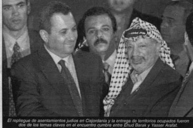
El repliegue de asentamientos judíos en Cisjordania y la entrega de territorios ocupados fueron dos de los temas claves en el encuentro cumbre entre Ehud Barak y Yasser Arafat.

Sin embargo, Barak pidió el retraso de la retirada de tropas, lo que fue rechazado por los palestinos. Informó la cadena de televisión estadounidense CNN. Al finalizar la reunión, que duró dos horas y media, Barak informó de que Israel no tomará ninguna medida sin el consentimiento pleno de la ANP (Autoridad Nacional Palestina). Pero advirtió que Arafat también tendrá que cumplir todos los compromisos asumidos al firmar el acuerdo de Wye, en el Estado de Maryland, en noviembre de 1998. Por su parte, Arafat, presidente de la ANP, dijo que su gobierno exigirá el cumplimiento cabal de lo pactado en Wye y frenar la expansión de los asentamientos judíos.