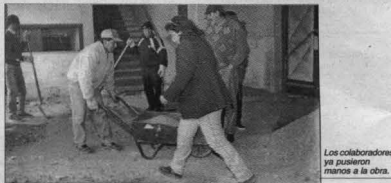
Los colaboradores ya pusieron manos a la obra.