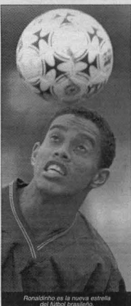
Ronaldinho es la nueva estrella del fútbol brasileño.

Y cuenta que Ronaldinho ya le adelantó que de aquí en adelante "van a agradecer todo lo que yo haga, y otras cosas las van a inventar". El flamante astro confía en su sangre fría, que le permite emerger triunfante hasta de sus errores, como ocurrió ante Alemania. "En el área gana el más frío, por eso Romario es el astro que es. Contra Alemania ejecuté mal el tiro penal, pero esperé el rebote y coloqué la pelota con tranquilidad: si hubiera disparado con rabia, el balón habría ido a la tribuna.