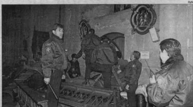
Destrucción realizada en el interior de la Catedral.

En medio de la trifulca se escuchó un disparo dentro de la iglesia, que según la policía, había sido efectuado con un revólver 38 hallado entre las pertenencias de quienes ocupaban la Catedral. Minutos después de que los manifestantes arremetieran con palos y piedras contra el edificio en el que se albergaron durante tres semanas, el fiscal Aldo Carnevale intentó dialogar con ellos para que abandonaran el lugar.