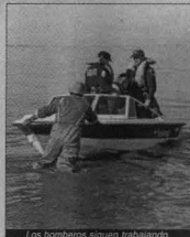
Los bomberos siguen trabajando.

A la tarde, con los voluntarios que una vez más aportaron sus embarcaciones y con la laguna dividida en cuadrículas por medio de boyas, se