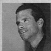
El actor llegó al país para presentar «Air América» una película que lleva turistas a donde yo estoy trabajando».

En «Air América» que desde el 1 de agosto se verá en AXN, la nueva señal del grupo HBO que está en Multicanal, Supercanal y Direct TV, Lamas es un ex marino de la milicia estadounidense que, como agente secreto, debe investigar el tráfico de drogas y armas en un país imaginario de Latinoamérica. «Mi rol es como el hermano mayor», definió Lamas en un encuentro con la prensa argentina. «Como soy un agente encubierto, mi disfraz es el de