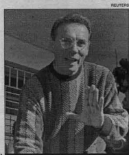
Jamil Mahuad considera que a fin de año comenzará a superarse la crisis económica.

El presidente sostiene que la economía comenzará a crecer a finales de este año y comienzos de próximo. Ecuador atraviesa por una de las peores crisis económicas de los últimos treinta años afectada también este año