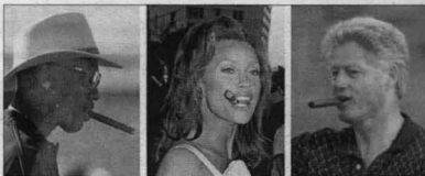
(Reuters) - Michael Jordan, Vanessa Williams y Bill Clinton demostraron que no sólo la fama los une. También algunos gustos comunes, como los habanos. Lo que no trascendió es si en los tres casos todo se reduce al hábito de fumarlos...