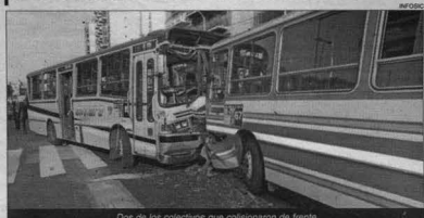
Dos de los colectivos que colisionaron de frente.