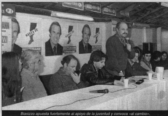
Biasizzo apuesta fuertemente al apoyo de la juventud y convoca «al cambio».

Mario Chiappano cerró su discurso diciendo: «debemos dejar de regalar pre-