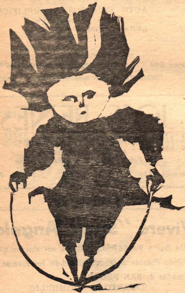
XILOGRAFIA IMPRESA CON EL TACO ORIGINAL REALIZADO POR JOSE RUEDA

Hoy a las 20 hs, se inaugurará exposición del presente ciclo, En es en la Biblioteca Alberdi la tercera ta oportunidad la muestra estará