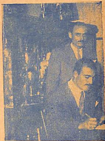
Carinche también aparece firmando el compromiso

miento y para seta oportunidad se ha preparado en forma tal como para establecer sus pretensiones y las de sus parciales, de ser el mejor púgil de nuestro medio.