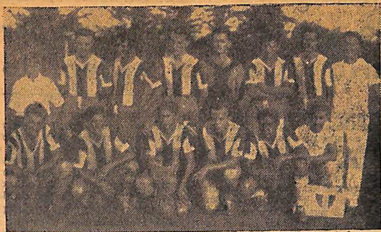
La escuadra de Central Argentino, que esta cumpliendo buenas actua-