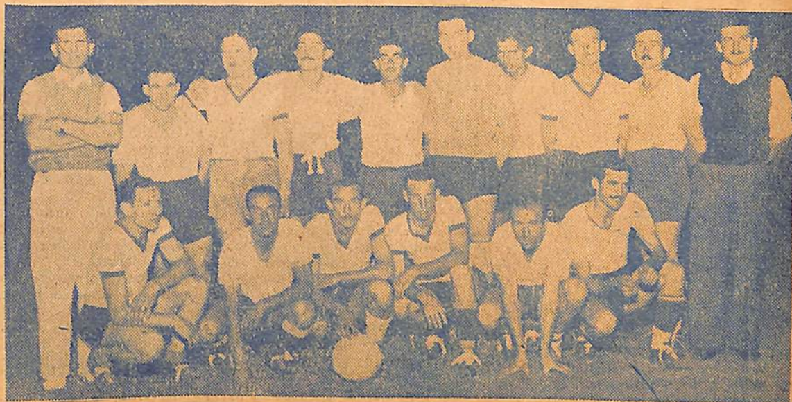
Sportsman, que será rival de consideración para Juventud

..Jorge Newbery, vencedor de (Sigue en pág. 16)