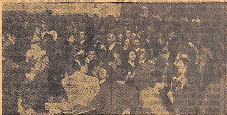
Vista parcial de la concurrencia que asistió a la inauguración

El lunes último Central Argentino, inauguró, como lo anunciáramos, su nueva y hermosa sede, con una reunión social que alcanzó por cierto, destacados contornos.