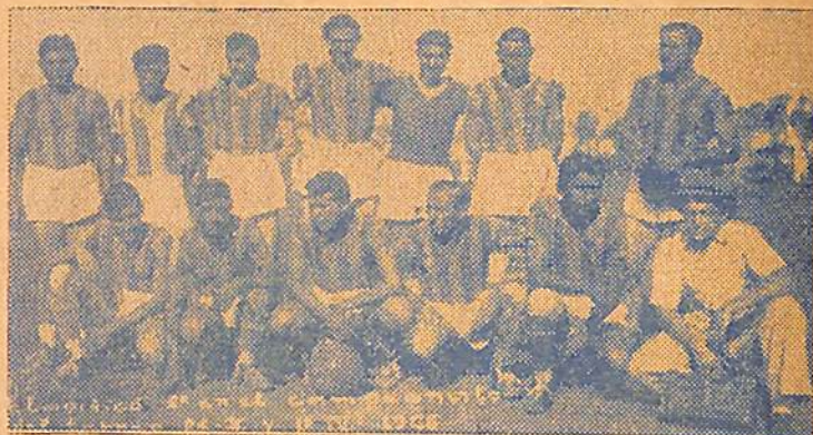
Gral. Belgrano volverá a presentarse en un field local

neas, en las que cuentan con valiosos elementos, permitirán indiscutiblemente que el juego a realizarse sea rápido y efectivo. Belgrano Juniors, cuenta en su favor con la presencia de una de las defensas más parejas de la zona, pero bien se sabe como suelen gastarlas los delanteros de la V. que por cierto no son de los