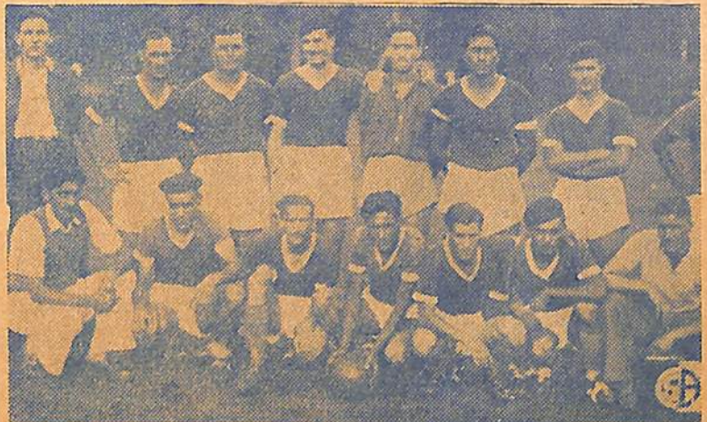
La escuadra de Avellaneda que ganó el torneo

Ante una falla de la defensa, el (sigue en pág. 20)