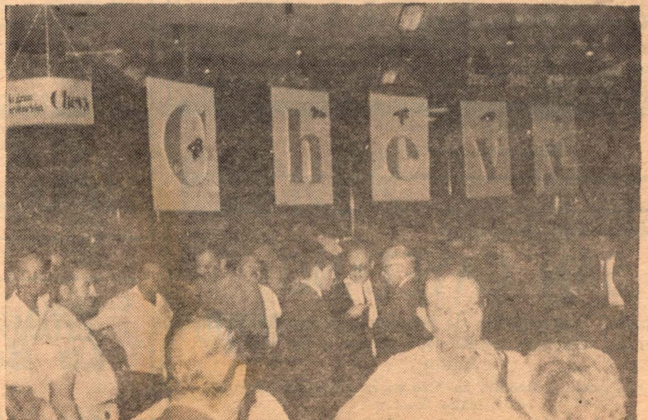
Vista parcial de la concurrencia