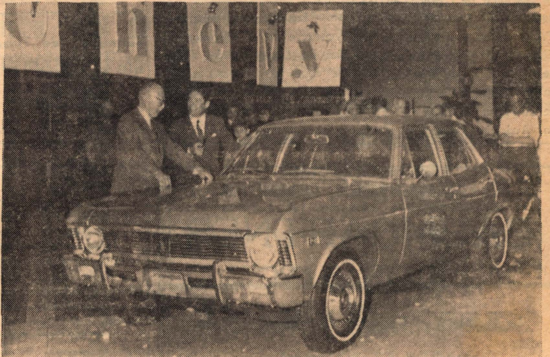
En el grabado apreciamos la nueva linea de este coche que causará sensación