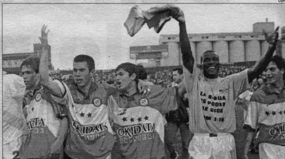
Argentinos sorprendió a River y festejó.

Los millonarios perdieron el invicto en este torneo (llevaba 5 triunfos y 2 empates) y finalizaron una semana 'negra', ya que perdieron el jueves 3 a 0 ante Cruzeiro en el Monumental y quedaron eliminados de la Copa Mercosur, además de perder la Recopa que estaba en juego.