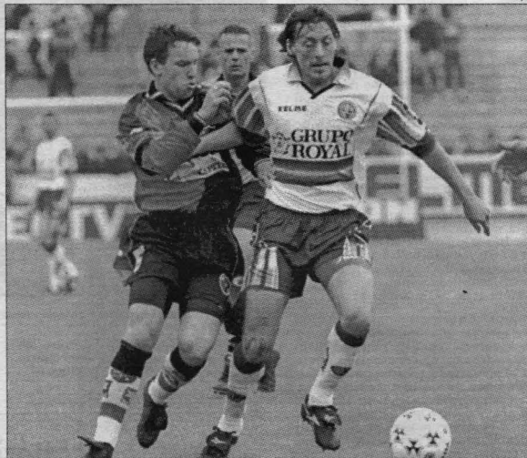
En un encuentro chato y con escasas emociones, Lanús terminó festejando.