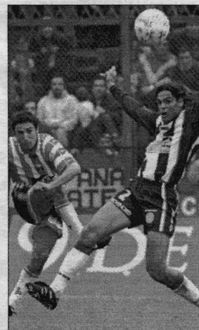
La recuperación de Estudiantes sigue en ascenso.