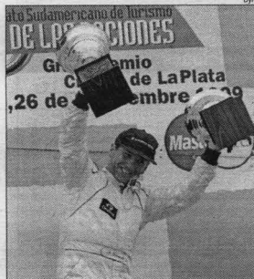
Fineschi y su alegría en el podio.

LA PLATA (Télam) - El piloto argentino Oscar Fineschi, al comando de un Chrysler Neon, se impuso ayer en la octava competencia de la categoría Turismo Sudamericano que por la Copa de las Naciones se disputó sobre 24 vueltas al autódromo Roberto Mouras de La Plata de 4.300 metros. Fineschi, que ganó de punta a punta, empleó un tiempo de 40m.08s.683/1000 a un promedio de 154.242 kilómetros por hora, seguido por el brasileño Carlos Bueno (Peugeot 406) a 4s.882/1000 y el actual campeón, el argentino Oscar Larrauri (Alfa Romeo) a 21s.766/1000. Posteriormente, clasificaron los brasileños Ingo Hoffmann a 23s.404/1000 y Flavio Figueiredo a 24s.252/1000 y el argentino Diego Menéndez a 25s.038/1000, todos con BMW 320i. Los diez primeros lugares puntuables fueron completados por nuestros compatriotas Amílcar Zanirato (Alfa Romeo 155), Juan Cusano (Toyota Corona),