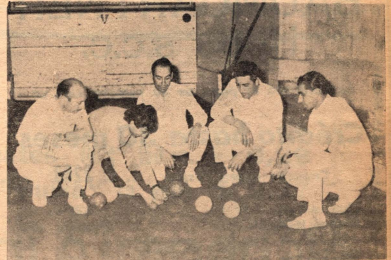
El equipo de la Asociación Venadense que se hizo acreedor al título de Campeón de Santa Fe cumpliendo una gran actuación.

En nuestra próxima edición ampliaremos detalles de este campeonato.