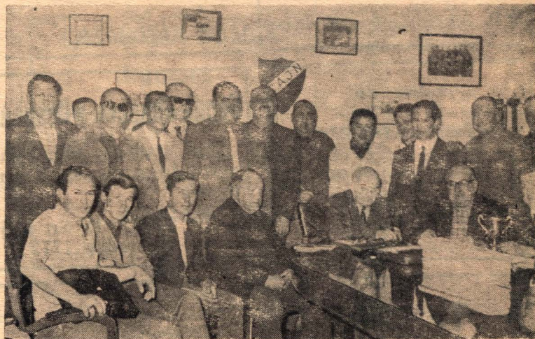
Los delegados de las distintas Asociaciones reunidos en el Congreso que se