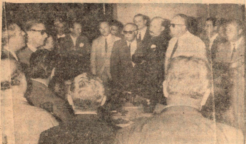
Empresarios venadense departiendo con el señor presidente del Banco Provincial