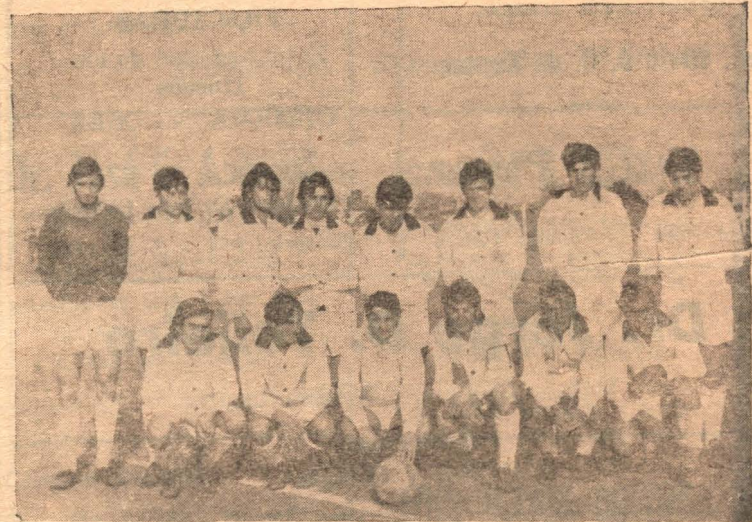
El equipo de Central Argentino que tratará de encontrarse con el triunfo.

Hoy a las 21,45 juegan Central Argentino y Unión y Cultura y Newbery y Avellaneda y el próximo sábado se jugarían las finales.