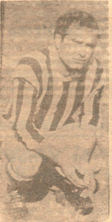
Tranquili: Gran valor de Teodelina que mañana tratará de obtener la victoria ante Sportivo Rufino, para no perder su expectante posición en la tabla de valores.