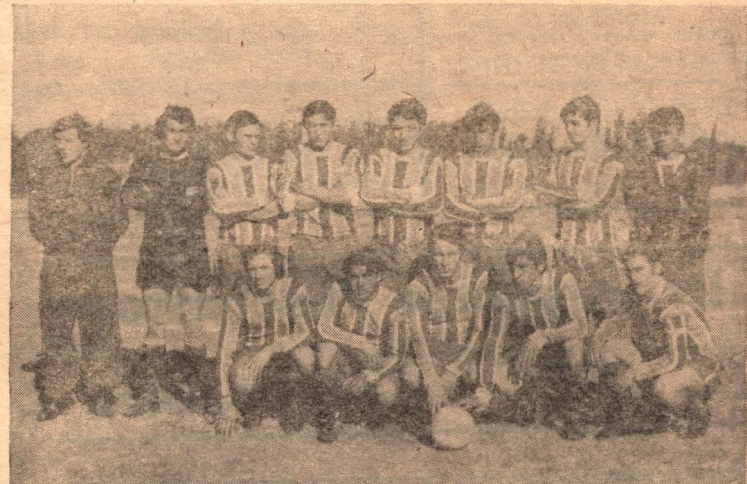
Jorge Newbery que tendrá difícil rival en Sportivo Avellaneda.