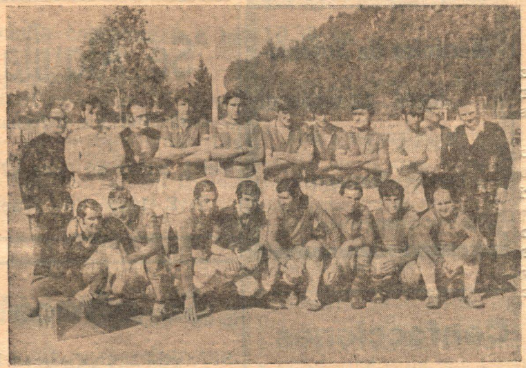
El equipo de Belgrano, segundo junto a San Martín que visitará el día del reducto de Matienzo en Rufino.