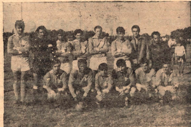
El equipo de Talleres que tiene serias aspiraciones para los partidos finales.