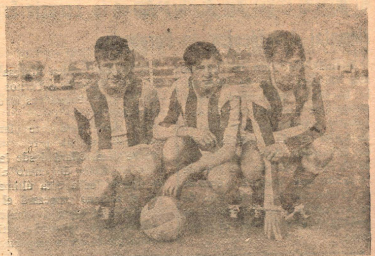
Tres de los hombres de Centenario que irán por su primer triunfo ante Defensores, equipo éste que en su última presentación empató en dos goles con su tradicional rival, San Martín en un partido que le fue favorable en todo su transcurso.