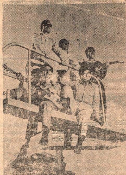
The Jumpers, que animará los Bailes de Carnaval en el club Centenario

Asimismo hace público su agradecimiento por todas las colaboraciones al adquirir la misma.