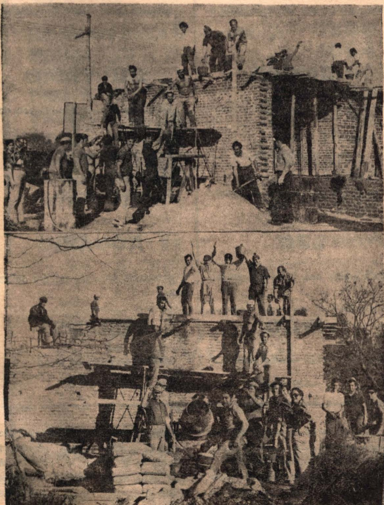
Un grupo de obreros del SINDICATO DE LA CARNE en plena tarea, dando forma real al sueño de la sede social propia

Por cierto que esta elección del jurado hizo justicia a esta belleza de nuestro Sur Santafecino y la localidad de Elortondo, hoy vive alborozada la euforia y el orgullo de esta designación, por poder demostrar con esta Reina que, significa a esta laboriosa localidad cuya comunidad sabe de esfuerzos, de trabajo y de mujeres hermosas.