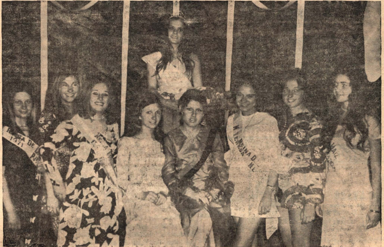
En esta nota gráfica pueden nuestros lectores apreciar la belleza de la Reina Departamental del Maíz, elegida en Murphy, rodeada de sus princesas y de cuantas aspirantes participaron en dicha elección.

Con motivo de la habilitación de las nuevas, modernas y