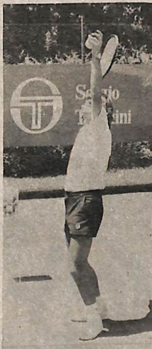
Prof. Daniel Negruchi.

Por lo general, dos tipos de saltos son los más empleados, uno de ellos es el salto tijera, con el cual el jugador se eleva en el aire haciendo una patada con el pie derecho yendo hacia adelante y el izquierdo pateando hacia atrás. El otro tipo de salto es saltando sobre el pie derecho. Estas son variantes que no deberá incurrir un principiante, puesto que al no tener un timing y el equilibrio perfecto que logran los profesionales, perderá el control y la justeza en sus envíos.