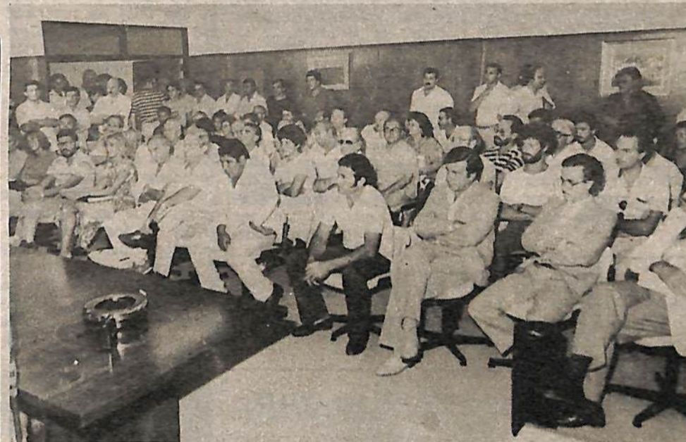
Numerosos asistentes a la reunión, un tema que interesa. Intendentes y Presidentes Comunales durante la conferencia.