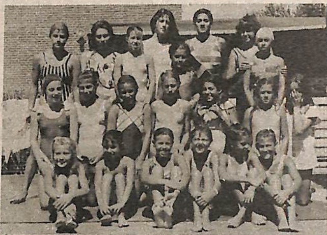
Grupo de niñas integrantes del equipo de competición.

Se realizará el próximo sábado 12 de marzo a partir de las 14 hs. un interesante Torneo de Natación, organizado por el Departamento de Educación Física del Jockey Club de nuestra ciudad. Participarán del mismo prestigiosas instituciones de nuestra zona, Belgrano de Arias, Arias Football Club, Club Atlético Guatimozín, Somisa de San Nicolás, Club Alumni de Casilda, Club Universitario y la entidad organizadora, el Jockey Club. La entrada al mismo será libre y gratuita.