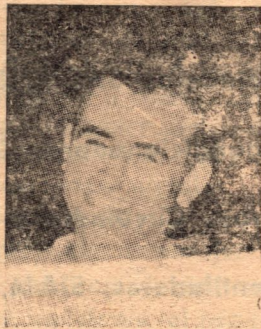
Camilatto de Dep. Atenas