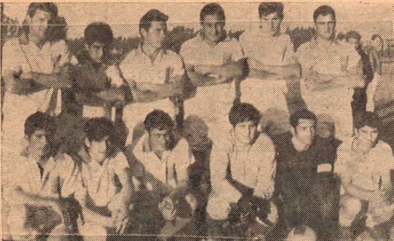
El equipo de Talleres que dijo nó, a las aspiraciones de Unión y Cultura, al restarle un punto