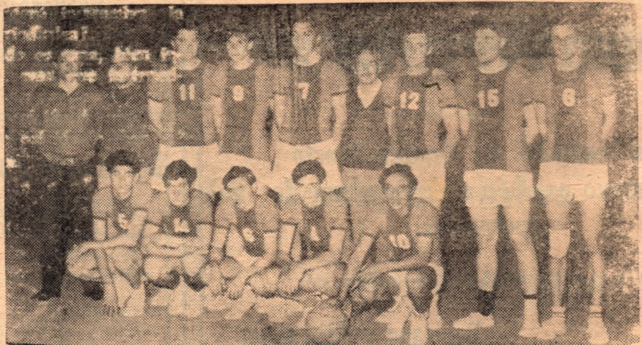
Atlético de Elortondo, el último Campeón