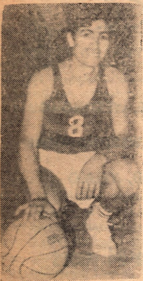
Abrigo de Olimpia B B C

El jueves próximo dará comienzo el Torneo Oficial, en la primera fecha Atenas - Boxing (2da.)