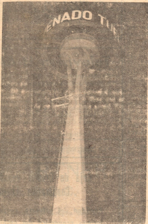
Arco de Entrada de nuestra ciudad, exponente de una idea de futuro, singularmente interpretada