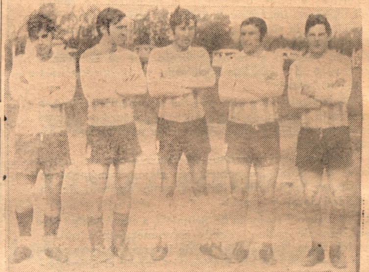
El ataque de Unión y Cultura, Vilchez, Irureta, Cossio, Mamazza y Carballo su juego no respondió al deseo de sus simpatizantes.