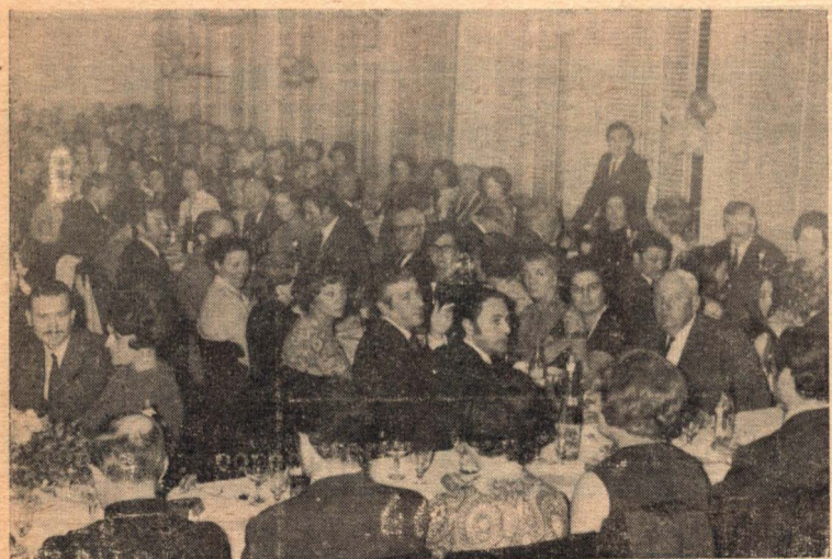
Aspecto de un sector del salón de la Industria donde fue celebrado el Día