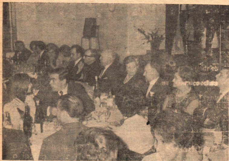
Cabecera de la Mesa del Banquete de los Industriales