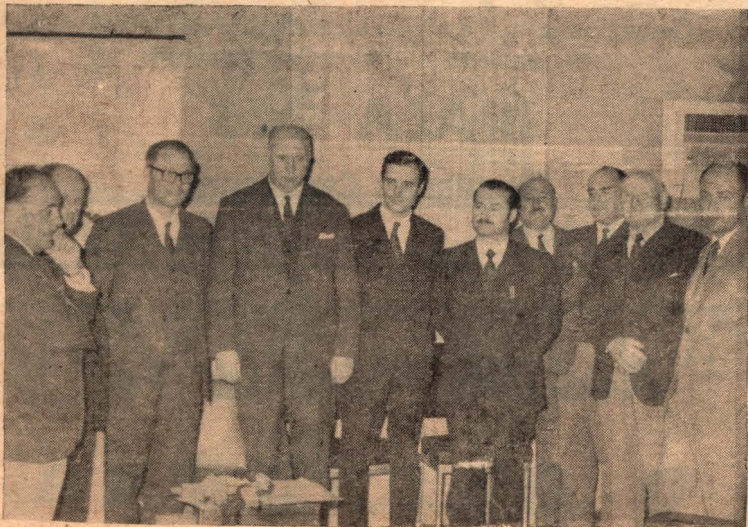
El señor Intendente Municipal de ENTel y periodistas acompañados de las autoridades

El ministro de Educación y Cultura de la provincia, profesor Ricardo Pedro Brueta, suscribió la resolución número 539 por la que establece que todos los establecimientos dependientes del Consejo General de Educación, durante los días 1 y 2 del actual permanecerán inactivos a los efectos de posibilitar a los maestros el cumplimiento de las tareas posteriores del Censo.