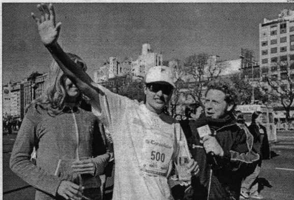
Gabriela Sabatini ganó la maratón femenina de los famosos.