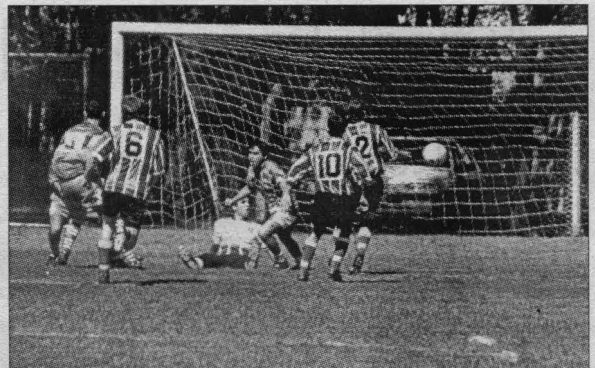
El Kily Camelis (tapado por Solans) acaba de anotar el primer gol y todo Ciudad Nueva sale a festejato.