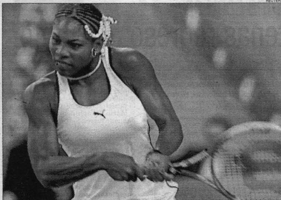
Serena está imparable y quiere ser la reina negra del tenis mundial.

MUNICH. (Télam-SNI).- Serena Williams, de 18 años, ganó ayer el duelo con su hermana mayor Venus, tercera del escalafón, al vencerla en la final de la Copa Grand Slam de tenis por 6-1, 3-6 y 6-3.