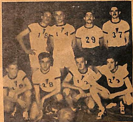
La 2ª. de Sportman, de Villa Cañas