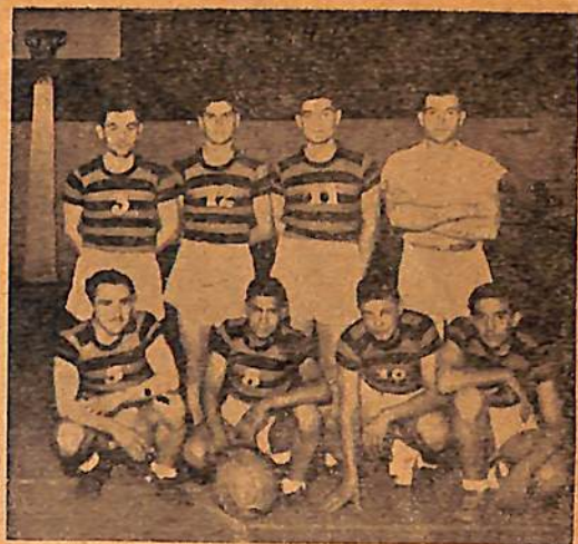
1°. Div. de Olimpia, de Venado Tuerto

Los muchachos; que lo aprendieran en las escuelas primarias, sentían un poco de