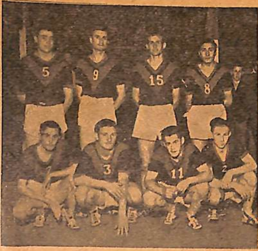
General Belgrano, de Santa Isabel

vidad absorbente de los grandes centros deportivos del mundo. En nuestro país ocupa indiscutiblemente y por derecho propio, el segundo puesto en las actividades del deporte nacional.