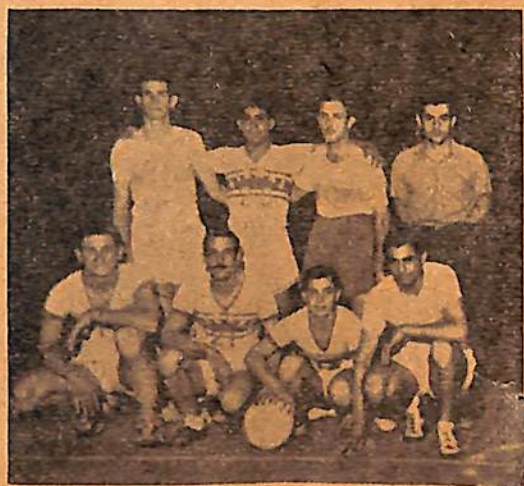
2°. Div. de Atenas, de Venado Tuerto