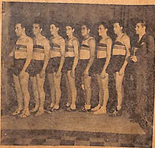
Equipo del Club Jorge Newbery, que venció en el torneo Relámpago organizado por el Club S. de Sancti Spiritu, el domingo último