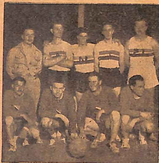
Club Jorge Newbery 1a. D.

Y, efectivamente, algunos clubs grandes — entre ellos el Gimnasia y Esgrima de Buenos Aires — comenzaron tímidamente a practicarlo, casi en secreto, con vergüenza, con equipos femeninos; equipos de mucha-