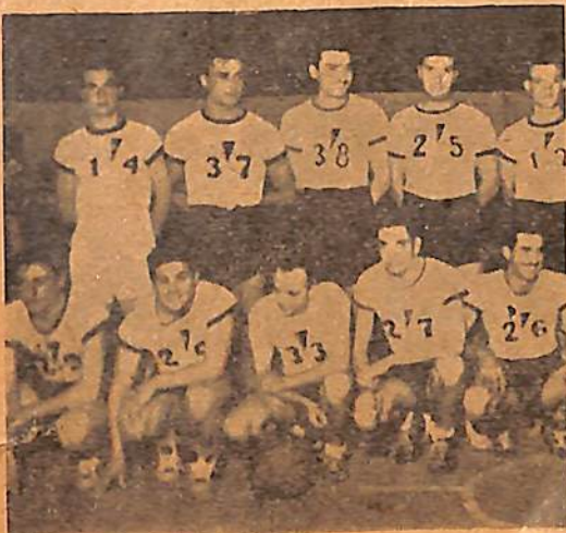
Sportman, de Villa Cañas, 1°. Div.

Una escueta nómina de los cuadros existentes dedicados a ese deporte, daría una clara y elocuente idea de su importancia.