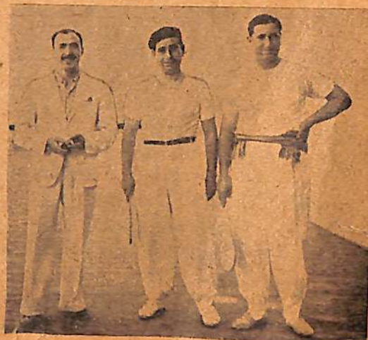
Parejas participantes en el torneo abierto del Jockey Club