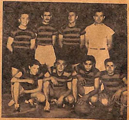
2ª. División del Olimpia, cuyos animosos muchachos, acusan grandes progresos