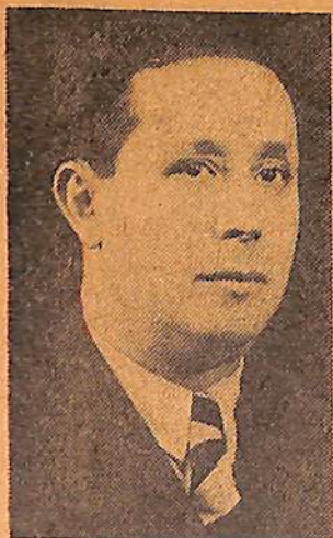
Señor A. Oroño Presidente de la máxima institución de bochas de reciente creación

Creemos que nadie podría afirmar, a ciencia cierta y talvez, ni por aproximación donde, cuando y como nació el popularísimo "juego de bochas".