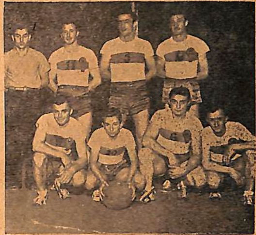
1°. Div. de Huracán, de Venado Tuerto

La región, que tiene por eje geográfico-económico a Venado Tuerto, está llena de clubs dedicado preferentemente a cultivarlo y el número de sus adeptos —ahora más hombres que mujeres— acrece de día en día.