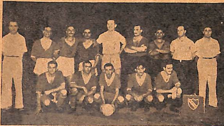
Los Andes, de San Eduardo

En nuestra próxima edición —pensando que la ha ganado en buena ley— publicaremos una ampliación fotográfica del eleven 1 del Centenario F. B. Club, vencedor en el encuentro por la 3 ra . fecha del Torneo Nocturno "Ovidio Lagos".