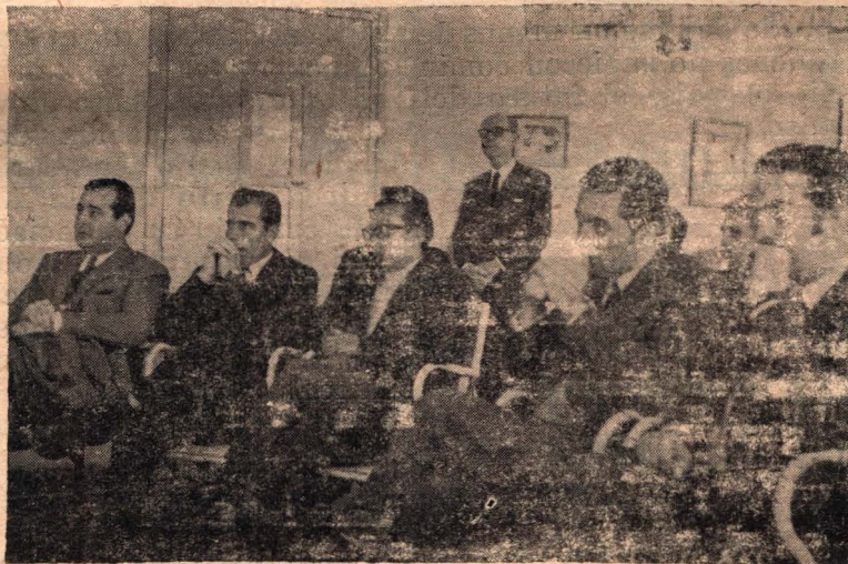
Grupo de Delegados de Asociaciones de Bomberos Voluntarios que asistieron a la reunión para constituir la Federación Provincial