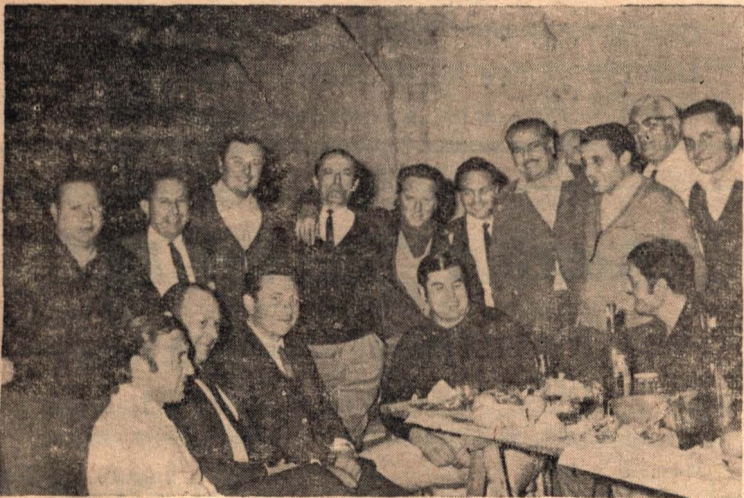
Conjunto de asistentes a la Peña del Trece.