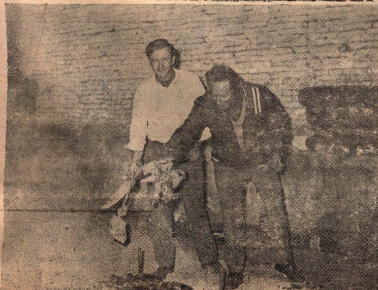
LE. COPELLO ASADOR — Es mas facil asar pollos que ganar en Maggiollo