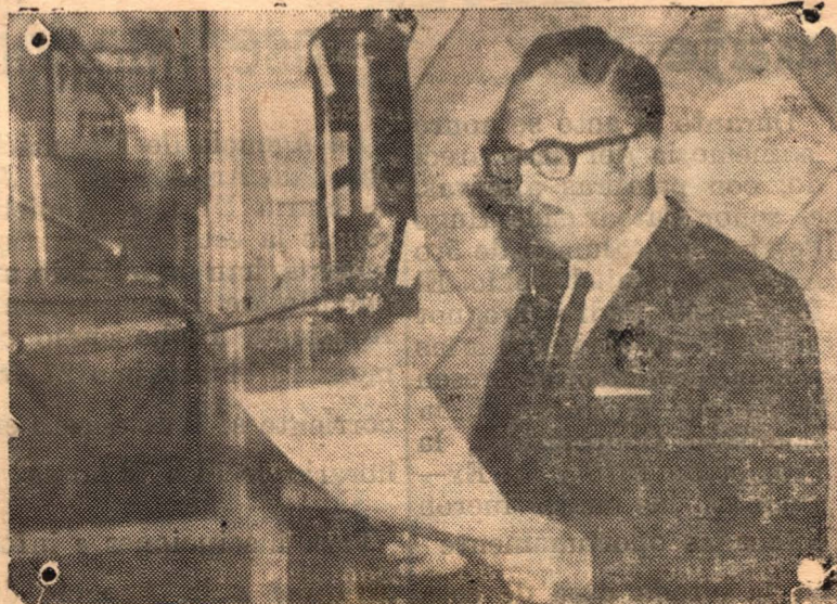
MOMENTO DE SU DISERTACION