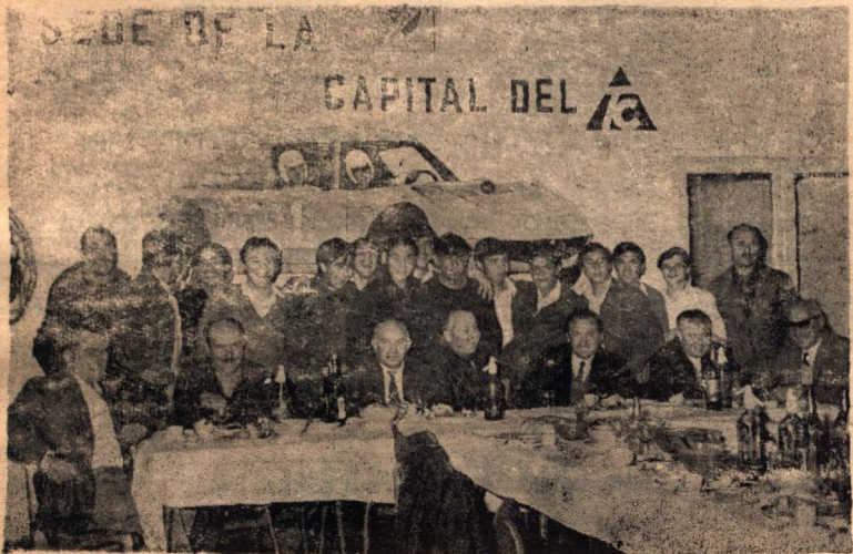
Newbery agasajó a su Cuarta Especial. Integrantes del equipo con sus directivos.

En la tarde de hoy juega con Santa Fe en cancha de Soc. Hebraica.