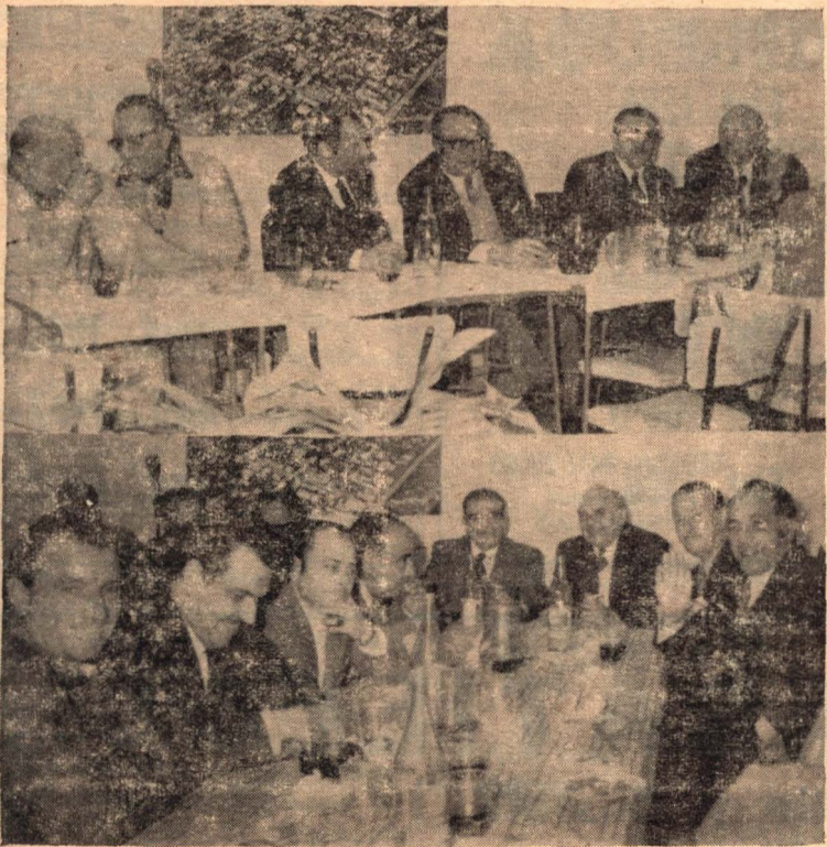
En la nota gráfica se puede apreciar la cabecera de la mesa ofrecida por la Policía local, al periodismo oral, escrito y televisivo. Otra vista de los asistentes del periodismo y directivos de la Cooperadora Policial, en la parte inferior.

En la Comisaría local, en el Salón de actos de la misma, tuvo lugar el lunes por la noche la demostración que las autoridades policiales, locales, ofrecieron a los representantes de toda la prensa escrita y oral de nuestra ciudad, con motivo de la celebración del Día del Periodismo, demostración que no pudo realizarse en aquella fe-