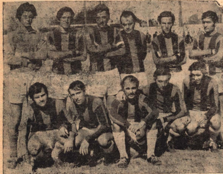
GRAL. BELGRANO STA. ISABEL