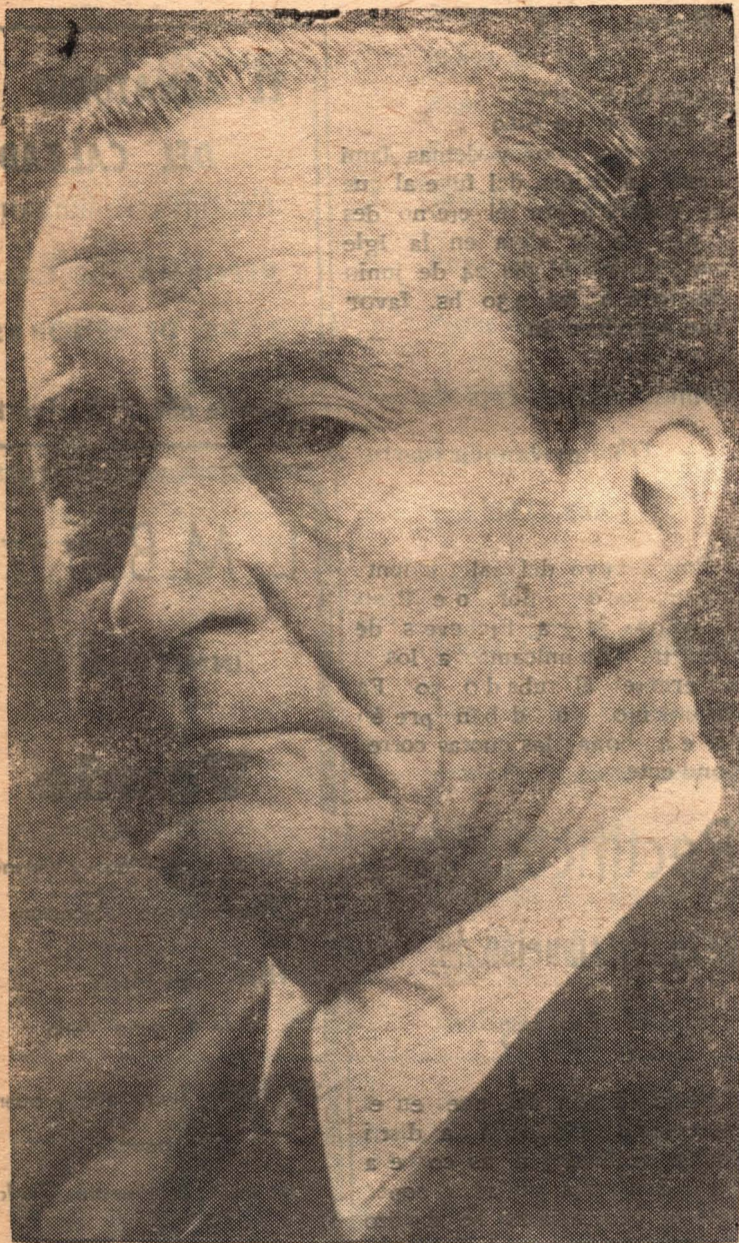
PEDRO EUGENIO ARAMBURU

Los días pasan y aun hay quienes alientan esperanza también hay quienes pare- cen no comprender el tre- mendo dolor que aflige a quienes interpretan el de- lito familiar y como ocurrie- ra el lunes en Santa Fe. a- parece una nota enviada por correo a un diario en la que se vuelve a comuni- car que se ha cumplido la fa- tal sentencia. Hay en esto sadismo puro, tanto si es verdad cuanto si es farsa. En esta hora nueva de nuestra vida institucional es justo clamar por un po- co de caridad.