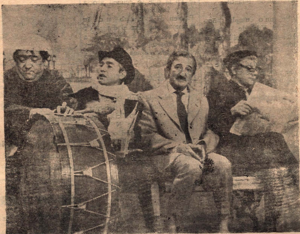
"Los Jubilados" fue sin lugar a dudas, uno de los sketches más festejados de "La Tuerca", producido por Proartel.

NUEVAS FIGURAS SE INCORPORAN A "LA TUERCA"