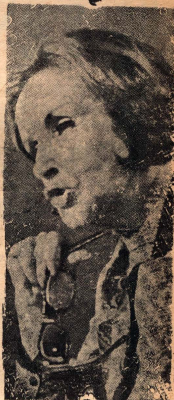
La gran actriz argentina Tita Merello, conductora del programa «Charlando de todo con Tita» que produce Procel. Su especial sensibilidad por los problemas humanos le permite iniciar cordialmente interesantes diálogos con gente ocupada en sus distintas actividades.

... y sus inquietudes. La una hora diaria de «Charlando de todo con Tita» —puede ya asegurarse— se ha convertido en una obligada teatula