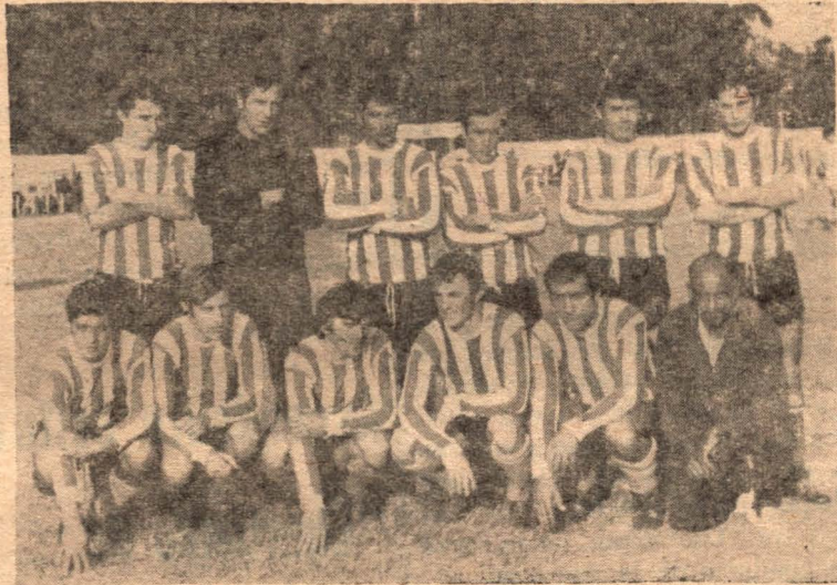
El equipo de la Liga Casildense que mostró muy poco futbol

a su ayudante de raya, éste no marcó nada.