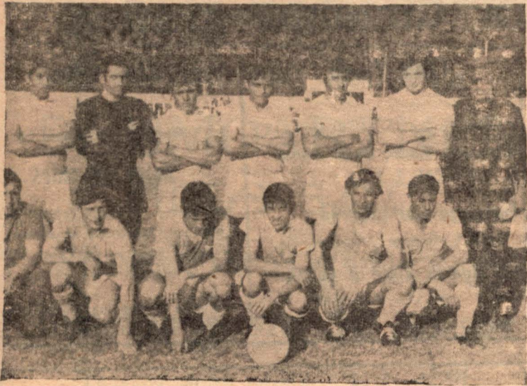
LIGA VENADENSE de opaca actuación, que el próximo domingo enfrenta a la Liga de CHAÑAR LADEADO