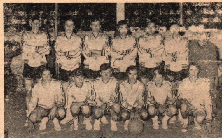
EL EQUIPO DE PEÑAROL