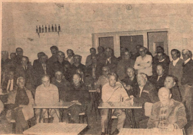
Parte del público reunido para considerar la situación.