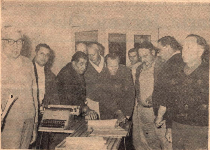
En el momento de la firma de las actuaciones a elevarse al gobierno.