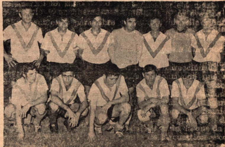
El equipo de Rivadavia que se adjudicó el torneo.