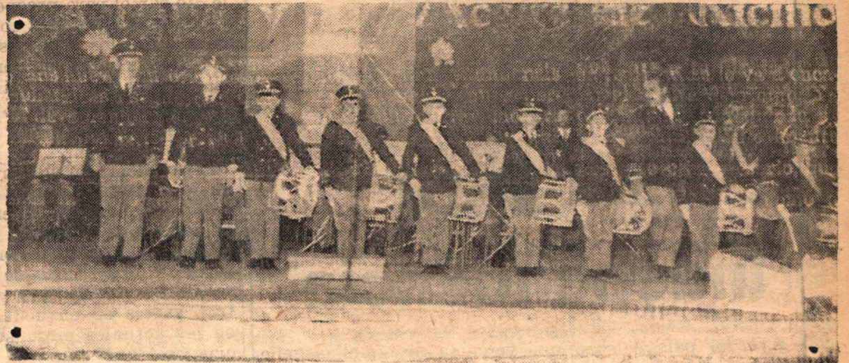
El cuerpo de integrantes de la Banda de Música Cayetano Silva de tan eficiente actuación en los acontecimientos ciudadanos de estos días bajo la batuta del maestro Corrado