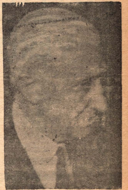
Dr. ARTURO ILLIA