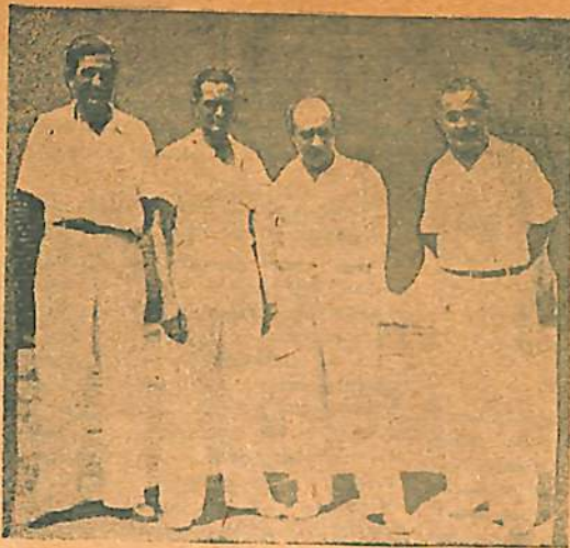
Equipo del Bochín Club