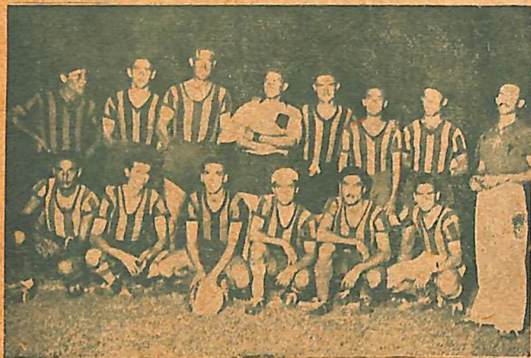
El poderoso conjunto de Racing Club de Colón, serio aspirante a finalista del actual certamen, cuyo juego penetrante y productivo, cuenta con admiradores