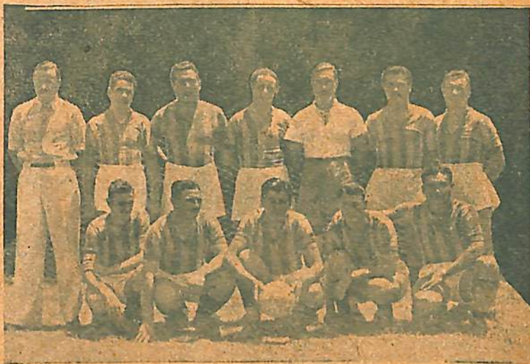
Equipo de Centenario F. Club, cuyas anteriores actuaciones, renovaron las esperanzas de sus partidarios. El Sábado último, perdió frente a Hughes F. Club