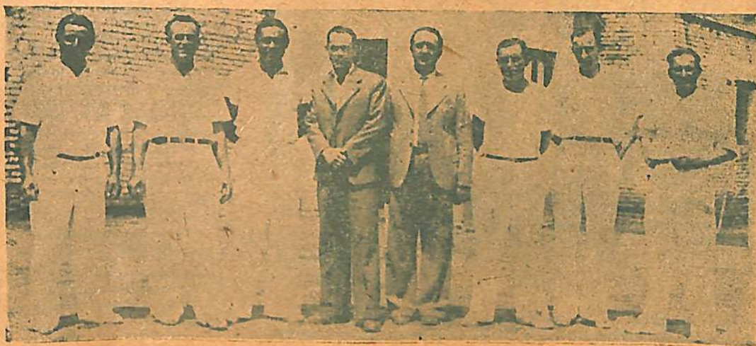
Defensores Venadenses y Olimpia