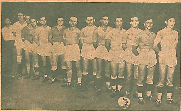
Conjunto de Hughes F. Club

Podría objetarse que el referé perjudicó la chance del equipo local pero, que dicen del penal evidente, que no cobró a poco de iniciadas las acciones, y que con toda seguridad habría puesto a la visita en ganancia por 2 tantos? Si aquel se hubiera sancionado, no podría haber cambiado el desarrollo de las acciones, pero a favor de los visitantes?