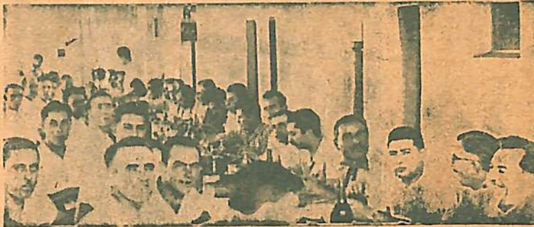
Un aspecto del almuerzo criollo realizado el Domingo en el Club C. de Empleados de Comercio