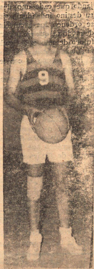
DOLAGARAY que sería de la partida en el encuentro final

Con este resultado pasa Olimpia a disputarle el derecho a Peñarol para saber cual de los dos pasará a la ronda final. El que lógicamente tiene mas posibilidad es Peñarol dado que se mantiene invicto y Olimpia tiene un partido perdido.