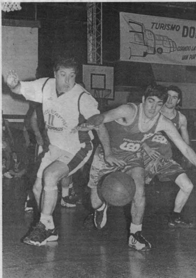
ELORTONDO por Jorge Toscano

Partiales por cuartos: 15/21, 35/42, 51/60, 62/76 Árbitros: Miguel Celi y José Laborde. Estadio: 'El Ateneo' del Deportivo Atenas. La figura: Carlos Jordán.