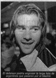
El defensor podría engrasar la larga lista de argentinos que pasaron por el Madrid.