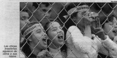
Las chicas brasileñas siguen de cerca a sus olores.

ASUNCION (Telam, enviado especial). Fese al intenso frío que caracterizó al último día de la Copa América de Paraguay '99, los simpatizantes de los equipos finalistas se las ingeniaran para montar un agradable espectáculo, entre el color de las banderas brasileñas y el energético aporte de los uruguayos, quienes con sus cánticos 'calearon' el ambiente. Fese a que el número de simpatizantes brasileños prácticamente triplicó al de los uruguayos, en función de la cercanía entre la frontera Foz de Iguazú y la capital paraguaya, los orientales se hicieron notar en el estadio Defensores del Chaco, y ganaron definitivamente el 'duelo verbal' ante la parcialidad rival. A sabiendas de que la venta de bebidas alcohólicas estaba prohibida en las inmediaciones del estadio, los orientales se reunieron en bares del centro asunceno para disfrutar de un jugoso aperitivo, para discurrir, entre otras, la ingesta de cerveza local y algunos tragos 'fuertes' para soportar el frío. La caravana uru-